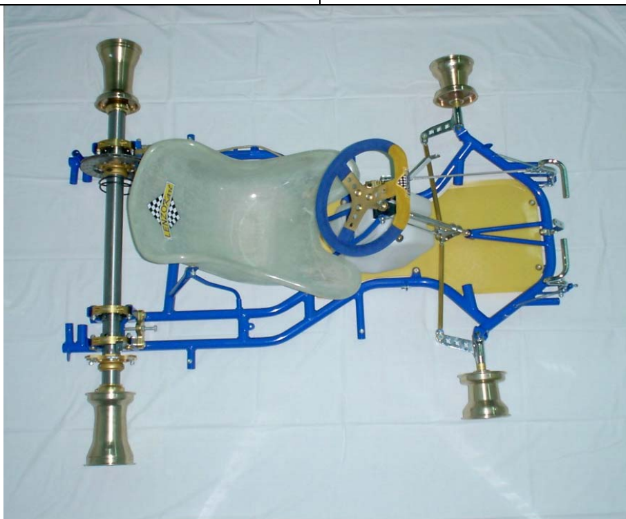
PHOTO VUE DE DESSUS DU CHÂSSIS COMPLET IDENTIQUE À L'UN DES MODÈLES PRÉSENTÉS À L'HOMOLOGATION SANS PARE-CHOCS, CARROSSERIE NI PNEUMATIQUES

This Homologation Form reproduces descriptions, illustrations and dimensions of the chassis frame at the moment of the CIK-FIA homologation. The Manufacturer may modify them, but only within the limits set by the CIK-FIA Regulations in force.